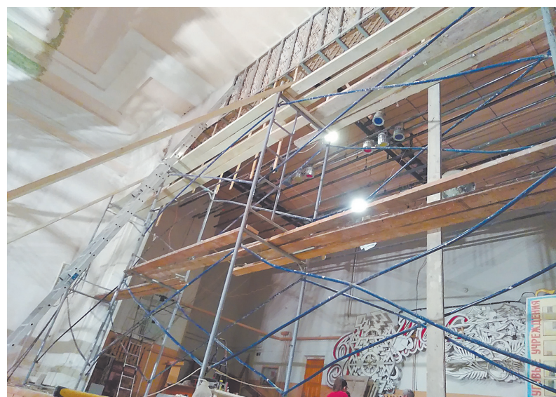
Ноябрь 2018 года. ДК в «лесах».