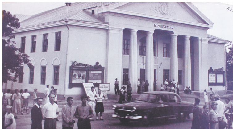
Сдан в эксплуатацию ДК ст. Кущёвской.