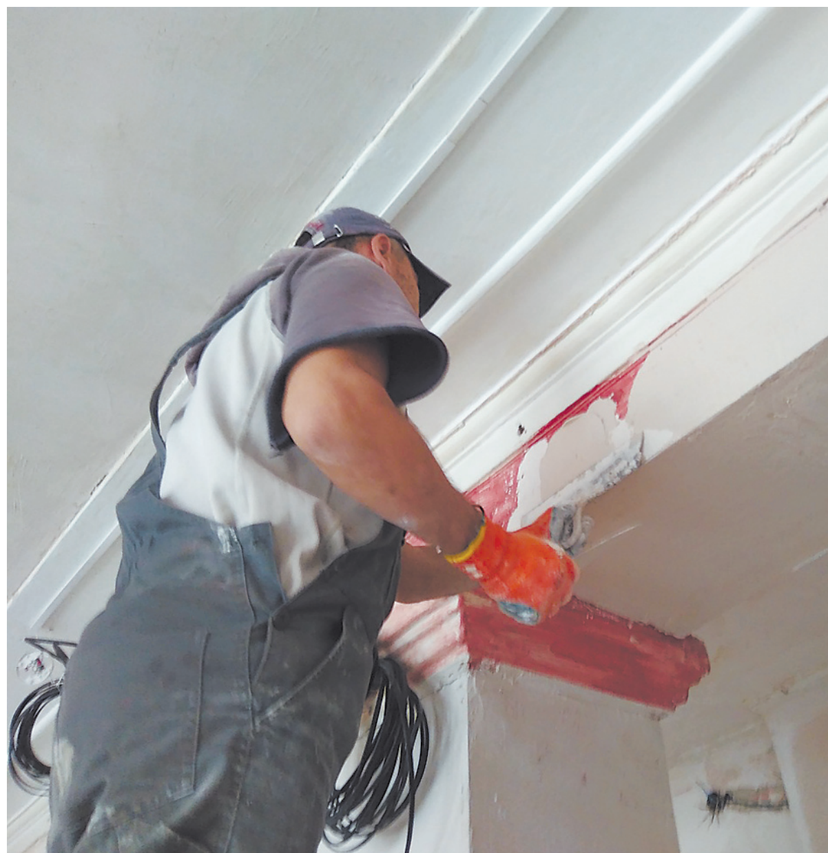
Ноябрь 2018 года. У рабочих дел непочатый край.

Как уживается под одной крышей ручной труд с творчеством? При содействии управления образованием кружки и секции переместились в Детскую школу искусств, близлежащие школы, а мероприятия проводят в Центре народной культуры и досуга «Радуга» и в Доме культуры «Степь».